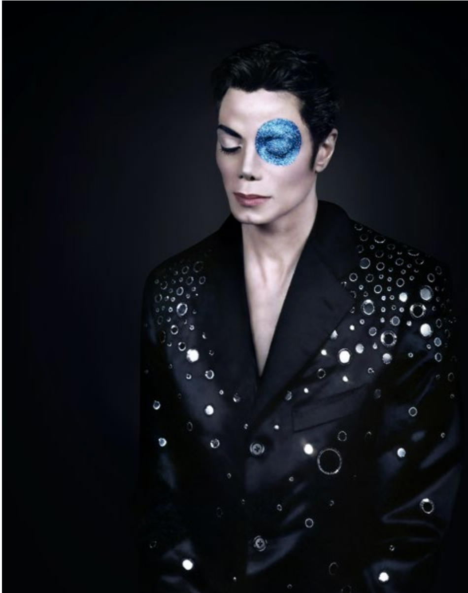
« Michael JACKSON à l'œil bleu »